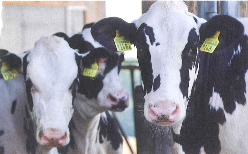
Un âge précoce au premier vêlage est intéressant à de nombreux égards.

L'élevage intensif de la remonte est un thème particulièrement actuel. Les six premiers mois de vie jouent un rôle central. C'est au cours de cette période que sont posés les jalons d'un âge précoce au premier vêlage et d'un niveau de production laitière et de longévité élevé. Mais quelles sont les interactions entre ces trois facteurs et comment les influencer?