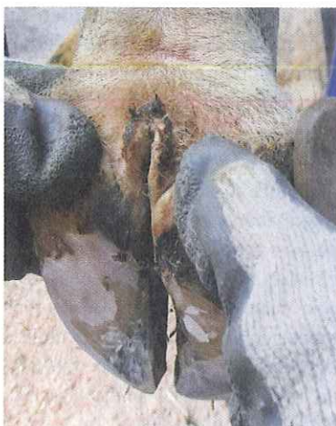
M3: stade de guérison; fermeture de la plaie, moyennement douloureux.