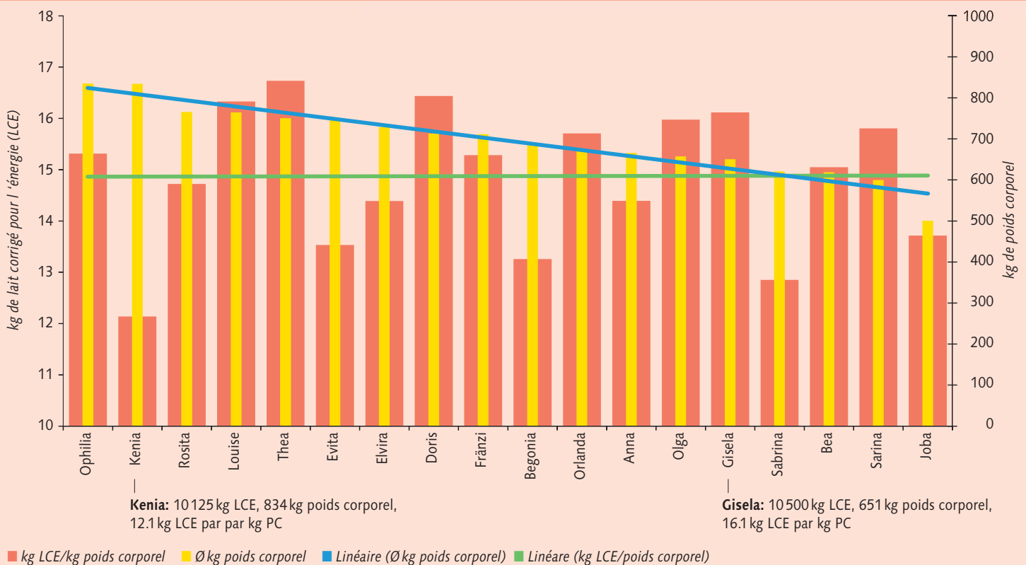
Graphique: Vaches du centre agricole de Liebegg en comparaison

Pour le potentiel d'ingestion de fourrage, la profondeur des flancs et la longueur du dos jouent un rôle tout aussi important qu'un format adapté.