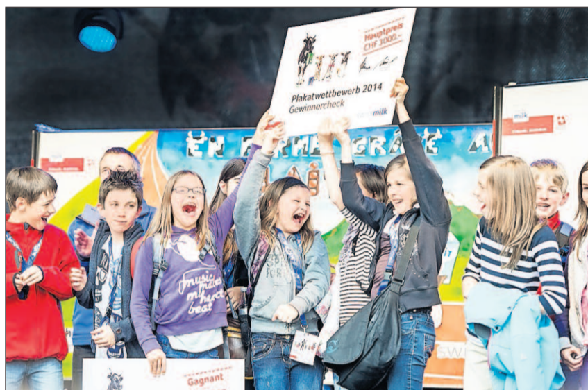
Le lait est l'allié des artistes et des petits futés: 81 classes l'ont prouvé en créant des affiches publicitaires amusantes, imaginatives et surprenantes.

Les écoles de Suisse étaient invitées à participer à un concours national en créant une affiche sur les bienfaits du lait pour la forme physique. 81 classes ont relevé ce défi et créé des sujets amusants et surprenants. À l'occasion d'un vote en