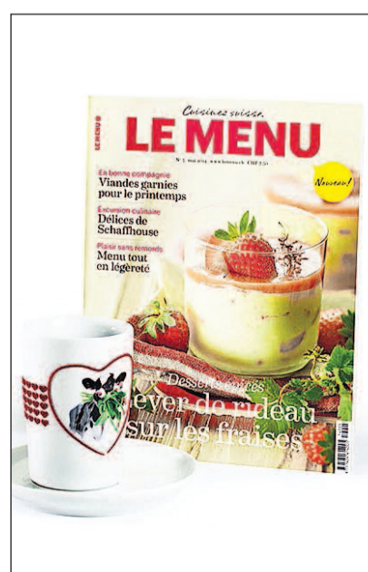
Les concours permettent à Swissmilk de transmettre des messages nutritionnels.

Un abonnement à LE MENU constitue un cadeau idéal pour la fête des Mères: si vous préférez ne pas vous en remettre au sort, vous pouvez passer commande sur www.lemenu.ch ou par téléphone au 031 359 57 70.