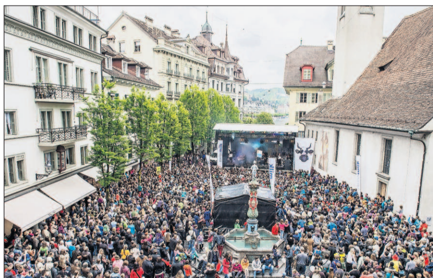
Le lait à l'honneur: sur la Kapellplatz de Lucerne, où le rappeur Bligg était de la fête, comme dans 90 autres localités du pays.

À Genève, Lausanne, Lucerne, St-Gall, Winterthour et Zurich ainsi qu'à Berne-Schönbühl, les nombreux visiteurs des stands du lait, en particulier les familles et les enfants, ont pu préparer et savourer de délicieux