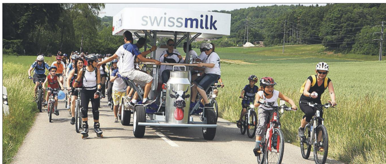
Recrutés sur Facebook, les amis du lait pédalent allègrement tout en distribuant des Yogi Drink aux participants du slowUp.

En attendant que la glace soit prête, les jeunes festivaliers écoutent les artistes, dansent et vibrent au rythme de la musique. Quant à leurs parents, ils n'ont pas été oubliés et peuvent savourer un milkshake en feuilletant le dernier numéro du magazine LE MENU, qui les inspirera pour le prochain repas familial.